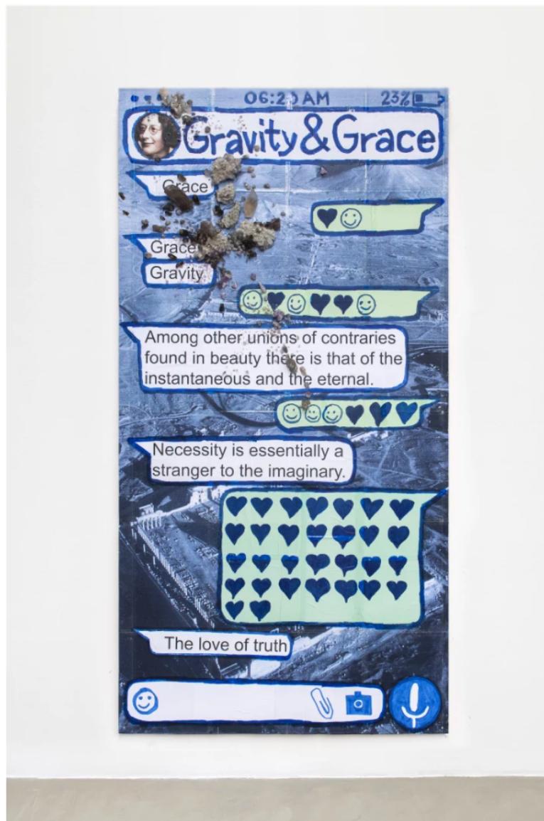
Thomas Hirschhorn, "Gravity and Grace (Chat-Poster)", 2020. Courtesy of l'artiste et Galerie Chantal Crousel, Paris.

Car je sais que l'art est résistance, l'art est résistance en soi. L'art résiste aux faits, aux faits politiques, culturels, sociaux, économiques et esthétiques. L'art résiste à toutes les injonctions et opportunités, mais aussi aux habitudes et aux modes. L'art est - en tant que résistance - beauté, positivité, il est absolu et autonome, l'art est en mouvement.